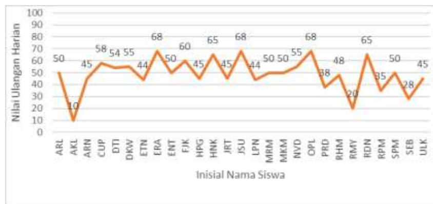
Grafik 1. Nilai Ulangan Harian

Peneliti memilih model pembelajaran problem based learning karena beberapa alasan, seperti siswa dapat terlibat secara aktif dalam proses belajar, materi yang dipelajari dapat dipahami dengan lebih mendalam, dan pengetahuan tersebut lebih mudah diingat karena siswa berpartisipasi langsung dalam proses pemecahan masalah. Problem Based Learning sebagai salah satu model pembelajaran yang memiliki ciri khas yaitu selalu dimulai dan berpusat pada masalah (Madini, 2020). Pembelajaran problem based learning adalah suatu bentuk pengajaran yang memberikan siswa kepercayaan diri untuk mencari solusi individu atau kelompok atas masalah yang mereka hadapi di dunia nyata. (Yusri, 2018). Dengan demikian dapat disimpulkan model pembelajaran Problem Based Learning merupakan model pembelajaran yang menekankan pada proses pemecahan masalah untuk mencari solusi dalam kehidupan nyata baik secara individu maupun kelompok.