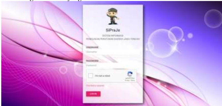
Gambar 1 Halaman Log-in SiPraJa

Pembuatan Sistem Informasi Penegakan Perda Jawa Tengah ( SiPraJa ) pada Satuan Polisi Pamong Praja Provinsi Jawa Tengah dibangun dengan menggunakan konsep basis data RDBMS ( Relational Database Management System ) yang mana pada prinsipnya sistem ini menggabungkan tabel-tabel dengan beberapa metode untuk bekerjasama. Penggunaan RDBMS ini telah sesuai dengan perkembangan teknologi informasi yang ada saat ini.