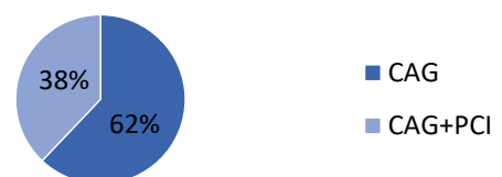
Gambar 1 Persentase Jenis Kelamin dan Jenis Pemeriksaan Pasien CAG dan Pasien CAG+PCI

Berdasarkan karakteristik pasien dari total 29 data diperoleh persentase sebagai berikut: jenis kelamin pasien CAG dan pasien CAG+PCI yang terdiri dari 22 data pasien laki-laki dan 7 data pasien perempuan dengan persentase laki-laki 76% dan perempuan 24%. Jenis pemeriksaan yang terdiri dari pemeriksaan CAG sebanyak 18 pasien dan pemeriksaan CAG+PCI sebanyak 11 pasien dengan persentase CAG 62% dan CAG+PCI 38% dengan rentang umur 40 tahun sampai 75 tahun. Berat badan minimum 50kg dan maximum 80kg, serta tinggi badan minimum 150cm dan maximum 174cm. Berikut adalah hasil yang diperoleh dari pengamatan estimasi nilai dosis DAP dan Fluoro Time pada pemeriksaan Coronary Angiography (CAG) dan pemeriksaan Coronary Angiography (CAG) dan