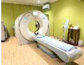
Gambar 1 : Pesawat CT Scan Canon Aquilion Prime 160 Slice